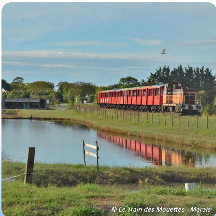
© Le Train des Mouettes - Marais

Pour une balade cheveux au vent, c'est à bord du train touristique