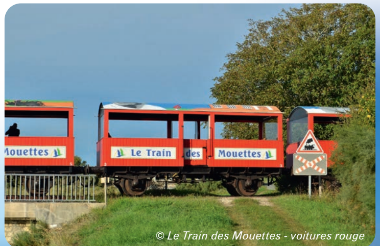
© Le Train des Mouettes - voitures rouge

www.seudre-ocean-express.fr et www.traindesmouettes.fr