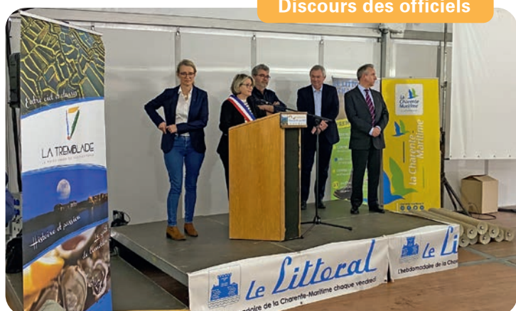
Discours des officiels

Après trois ans d'absence, ces deux jours ont permis aux professionnels de se retrouver pour échanger et mettre en avant leur savoir-faire et leurs innovations technologiques.