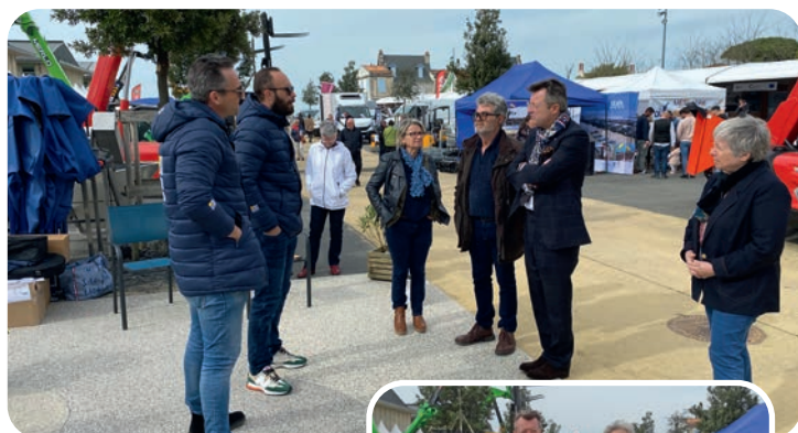
Visite du salon par le député Christophe Plassard