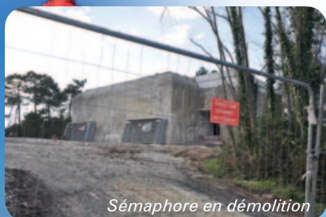
Sémaphore en démolition