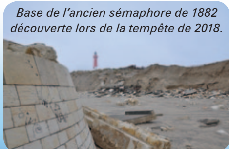
Base de l'ancien sémaphore de 1882 découverte lors de la tempête de 2018.