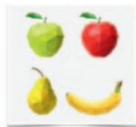
Une tarte aux pommes, poires, banane et chocolat