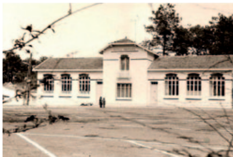
La façade de l'école primaire en 1972