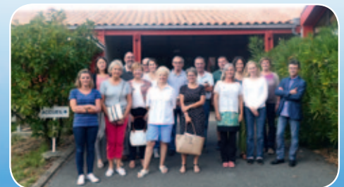
Nos élus visitent le site de l'IFREMER