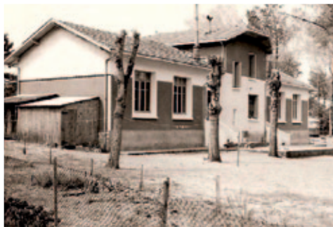
Les 2 classes encadrant le logement de fonction